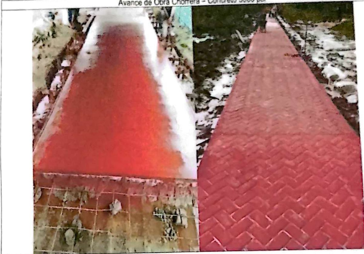
Avance de Obra Chorrera - Concreto 3000 psi

Secretaría de Planeación y Desarrollo Territorial - Dirección de Infraestructura Calle 10 No. 10 - 77 - Teléfono: (098) 592 4010 Leticia - Amazonas Colombia www.amazonas.gov.co