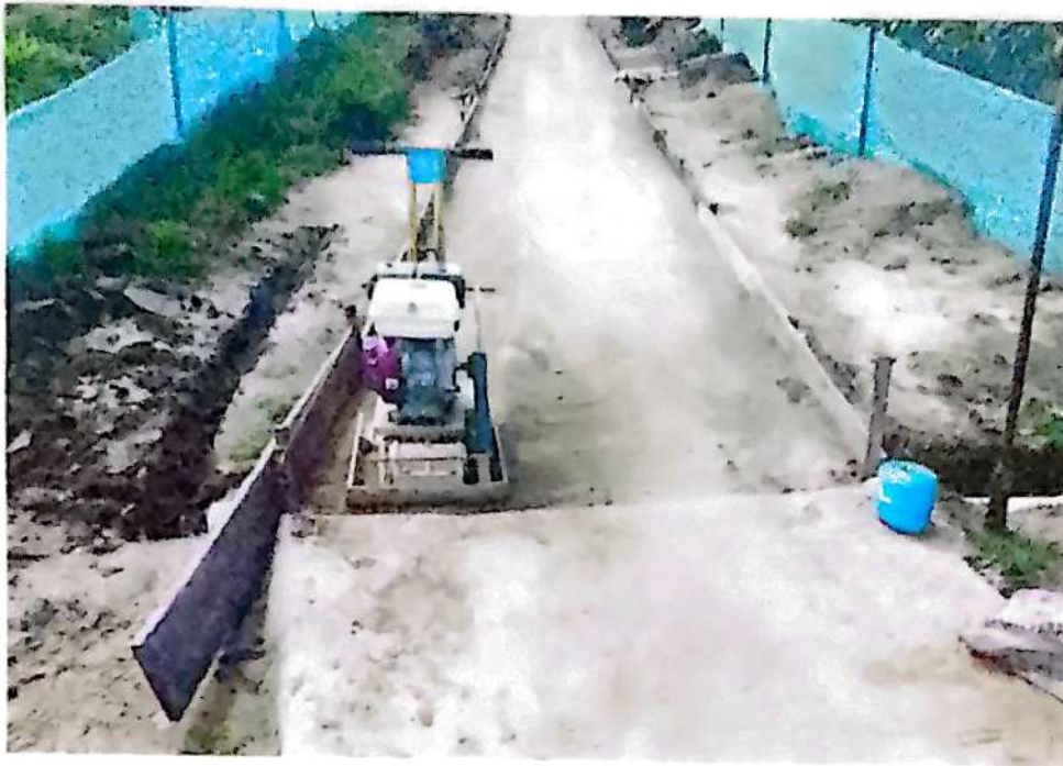
Avance de Obra Chorrera – Nivelación y Arena Cemento